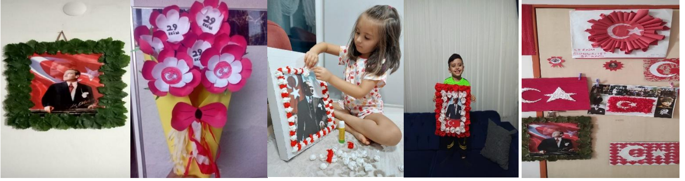
7- Atatürk ile ilgili gazete kağıtları ve atık malzemelerle sanat etkinliği yapıldı.